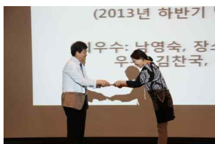
2013년 하반기 발표대회 우수 논문발표에 대한 시상이 있었습니다