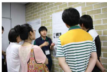
35개의 구두발표와 29개의 포스터발표가 진행되었습니다.