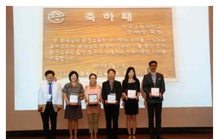
최근 3년 환경교육 박사학위 수여자에 대한 축하패가 전달되었습니다